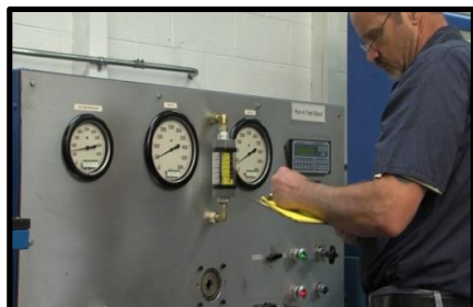
Fonctionnement spécifique sur banc

Notre laboratoire de réparation des servovalves a la capacité de réaliser des tests dynamiques et statiques contrôlés par ordinateur. Nos banc de tests informatisés de pointe garantissent que chaque valve est conforme aux spécifications du fabricant d'origine.