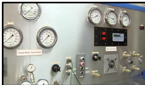
Test moteur couple et servo statique