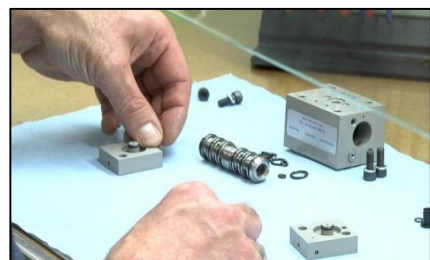
Bancs d'assemblage en salle blanche