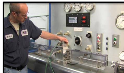
Test dynamique des servovalves