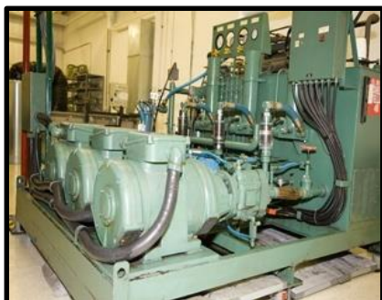
Unidades de Potencia Hidráulicas