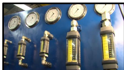
Prueba de Circuito Cerrado