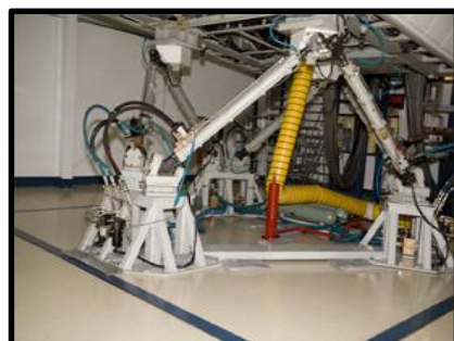
Piernas de Movimiento Hidráulicas